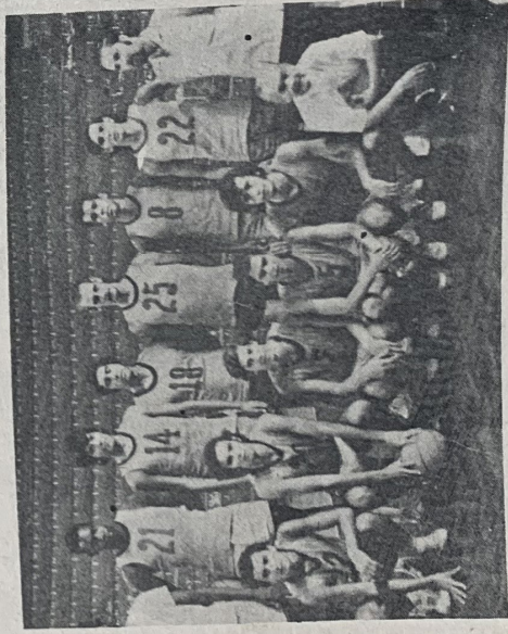
Selección Juvenil de Perú que el sábado se impuso a Uruguay en forma notable y hoy sigue con Brasil en el Torneo que se juega en Santiago.